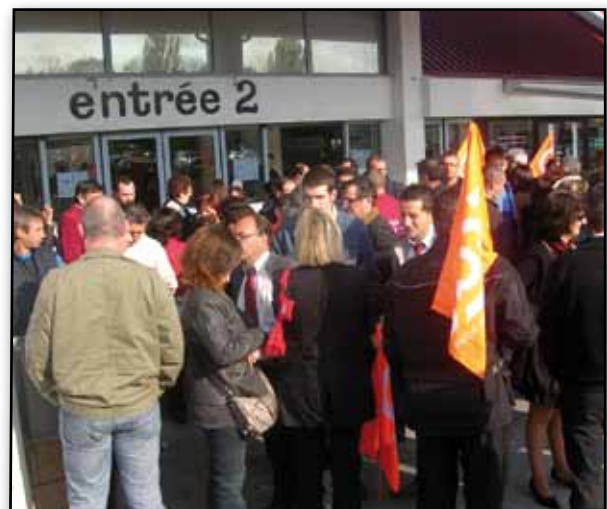
Salariés en grève - Carrefour Anglet

A St-Jean-de-Luz, les 1 er et 3 ème Mardi du mois, entre 15 et 17 h 00.